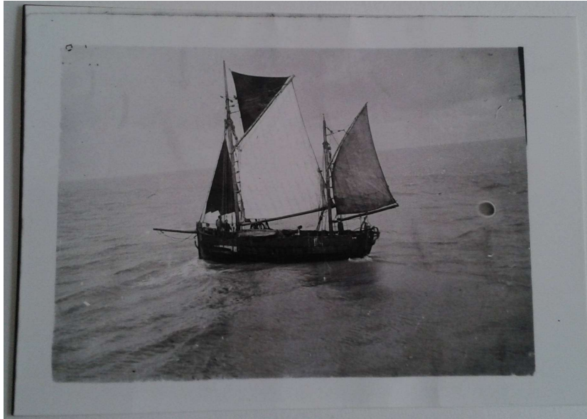
De bewuste briefkaart van december 1917.

Op de voorkant van de briefkaart staat de afbeelding van een dandy-kotter (Dundee-cutter):