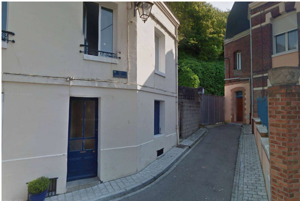
Augustus 2014. Nummer 19 is het huis links met de blauwe deur.