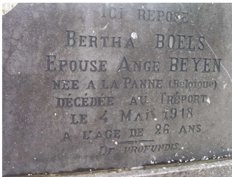
Let op de verkeerde voornaam "Bertha". Engel noemde haar steeds zo en ook voor het bidprentje werd deze roepnaam gebruikt.