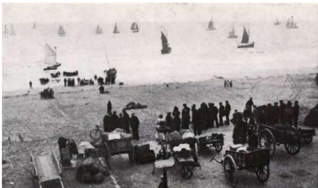
Oktober 1914. Belgische families op het strand in De Panne wachtend op een inschepping voor Duinkerke 1 .