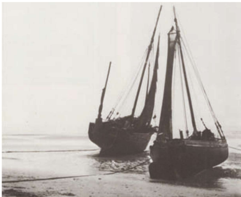
Juli 1916. Vissersboten op het strand in De Panne 6 .

Veel vissers van De Panne vluchtten met hun P-boten 3 naar Franse havensteden zoals Le Tréport, Dieppe, Fécamp, Le Havre en Saint-Malo 4 , andere bleven al dan niet gedwongen tot in 1916-1917 achter 5 .