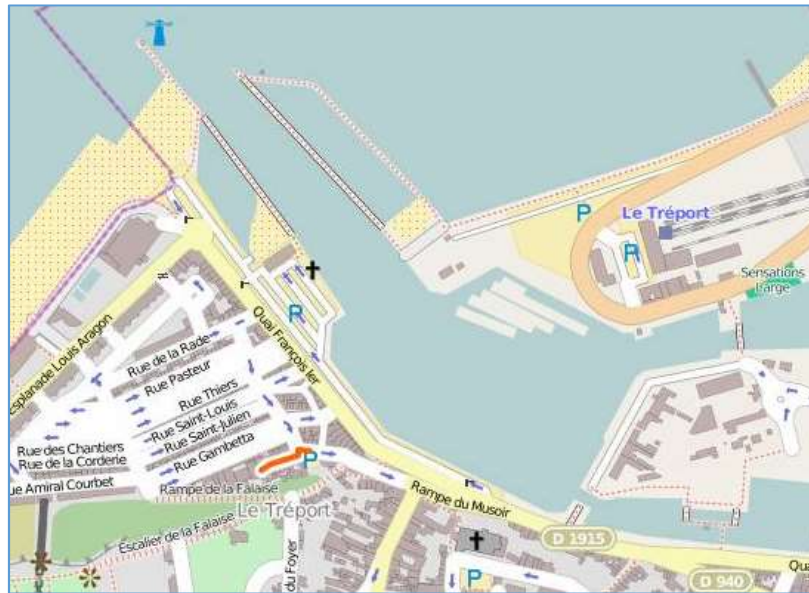
De rode lijn toont waar de rue de l'Anguinerie zich bevindt.

Zeer waarschijnlijk kwamen Engel en Anna daar met hun vier kinderen bij een pleeggezin terecht. Geen idee of er nog andere familieleden bij waren.