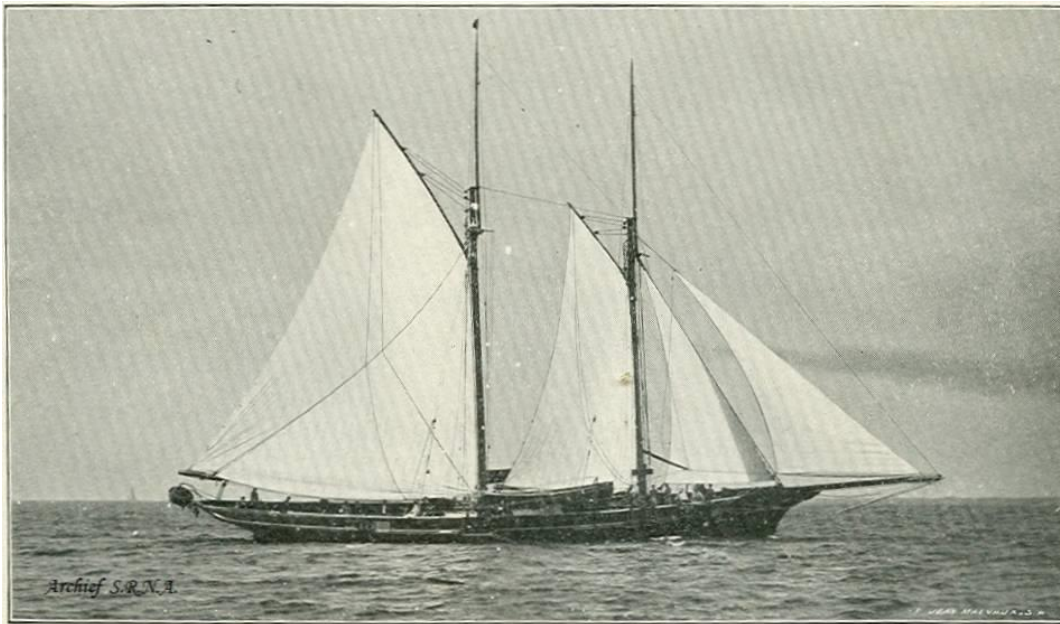
Fig 1- Het stoomjacht "Odette" van Georges Carels te Gent