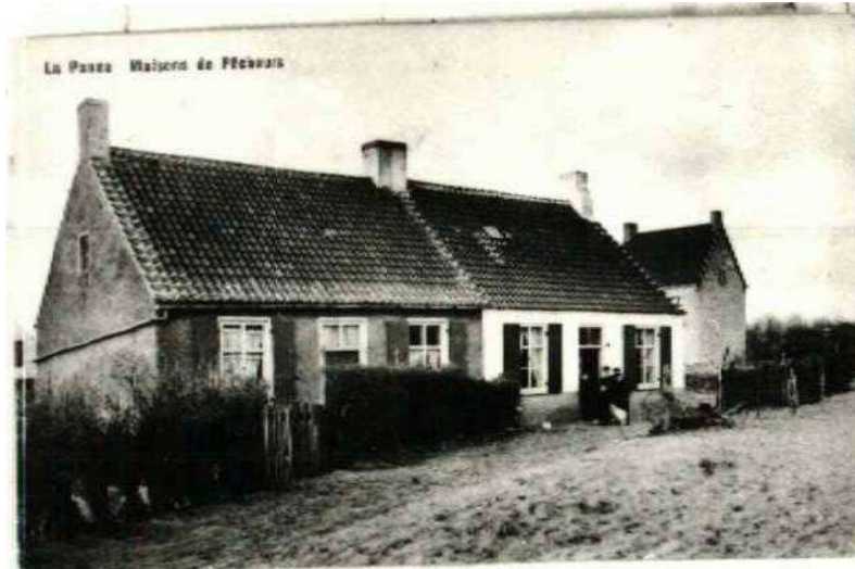
Fig 1- Voor het huis met de witte gevel staan nog een paar familieleden verzameld.

Naar persoonlijke notities van Julien Beyen, herwerkt door Nand Staes.